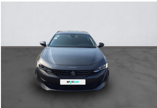
Groupe Mary groupemary.fr SPOTICAR