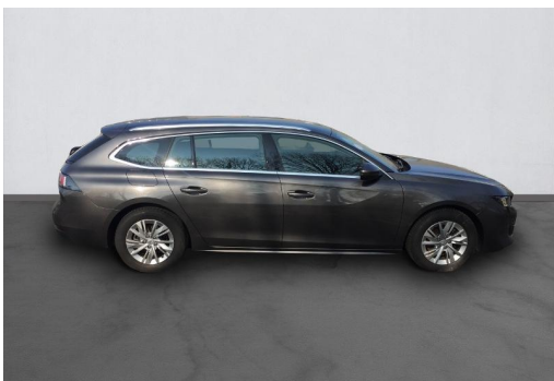
Groupe Mary groupemary.fr SPOTICAR