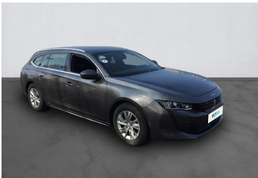
Groupe Mary groupemary.fr SPOTICAR