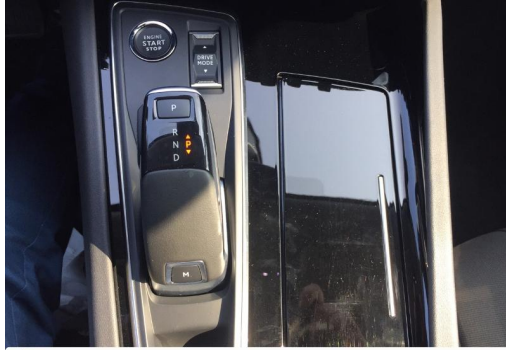
Groupe Mary groupemary.fr SPOTICAR