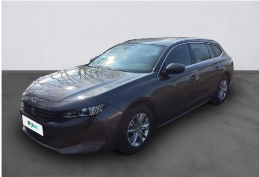
Groupe Mary groupemary.fr SPOTICAR