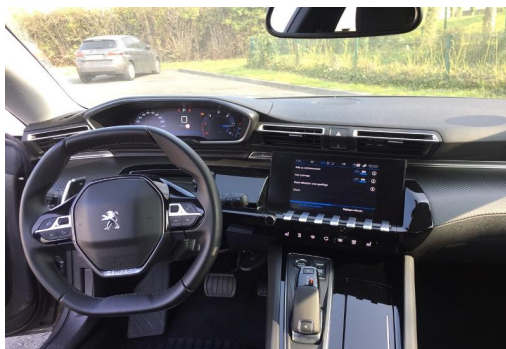
Groupe Mary groupemary.fr SPOTICAR