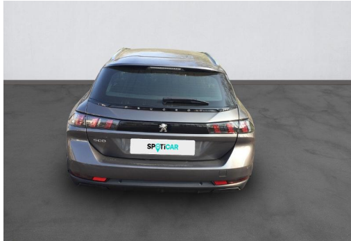
Groupe Mary groupemary.fr SPOTICAR