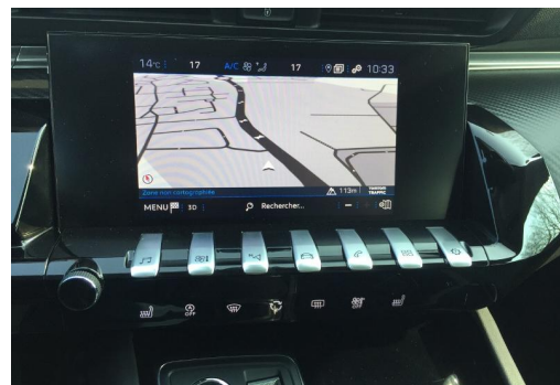
Groupe Mary groupemary.fr SPOTICAR