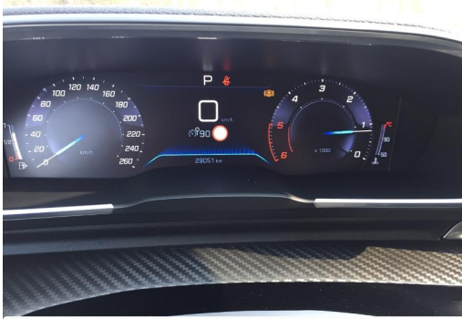
Groupe Mary groupemary.fr SPOTICAR