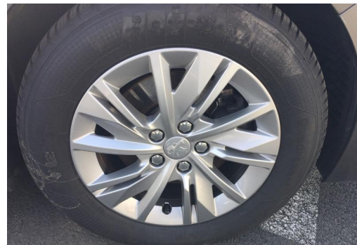
Groupe Mary groupemary.fr SPOTICAR