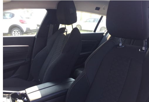
Groupe Mary groupemary.fr SPOTICAR