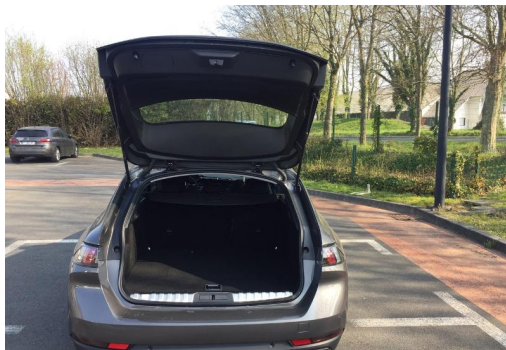
Groupe Mary groupemary.fr SPOTICAR