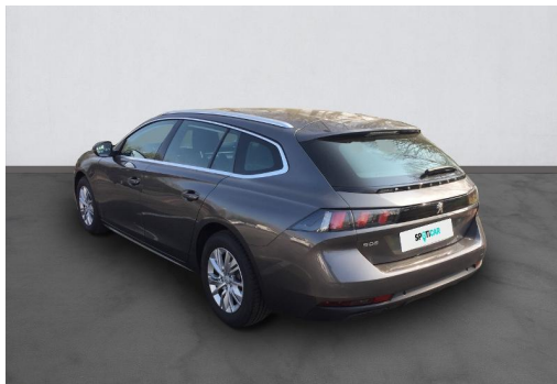
Groupe Mary groupemary.fr SPOTICAR